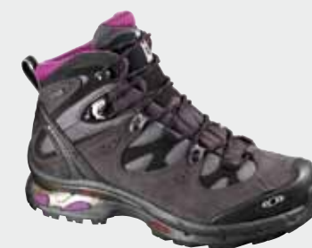
COMET GTX LADY